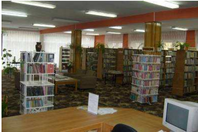
Rysunek 16. Wypożyczalnia dla dorosłych, stan z 2008 r. I piętro.