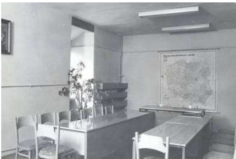
Rysunek 21. Dział Instrukcyjno-Metodyczny, stan z 1982 r. II piętro.