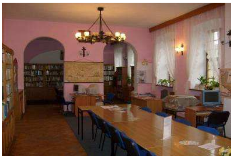
Rysunek 18. Czytelnia dla dorosłych, stan z 2008 r. I piętro.