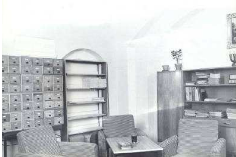
Rysunek 7. Dział Opracowania Zbiorów, stan z 1982 r. Parter