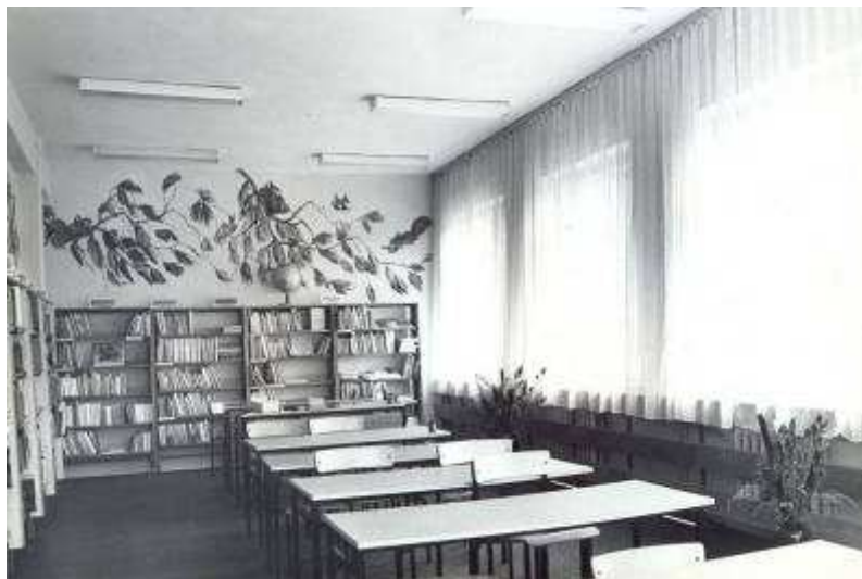
Rysunek 11. Czytelnia dla dzieci, stan z 1982 r. Parter.