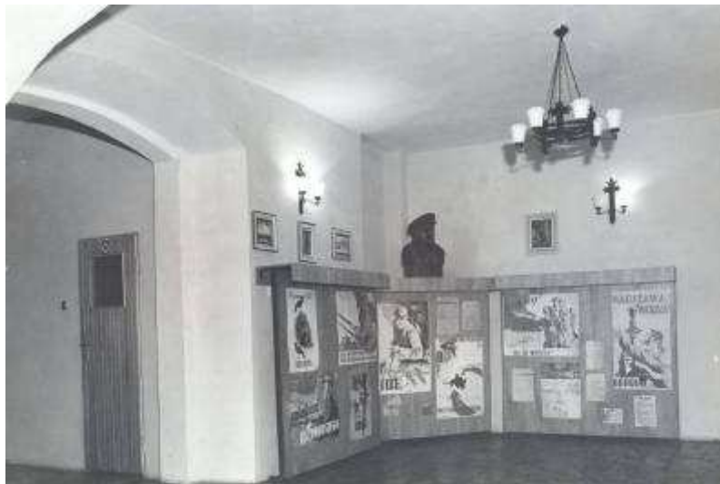
Rysunek 8. Hol wystawowy na parterze, stan z 1982 r.