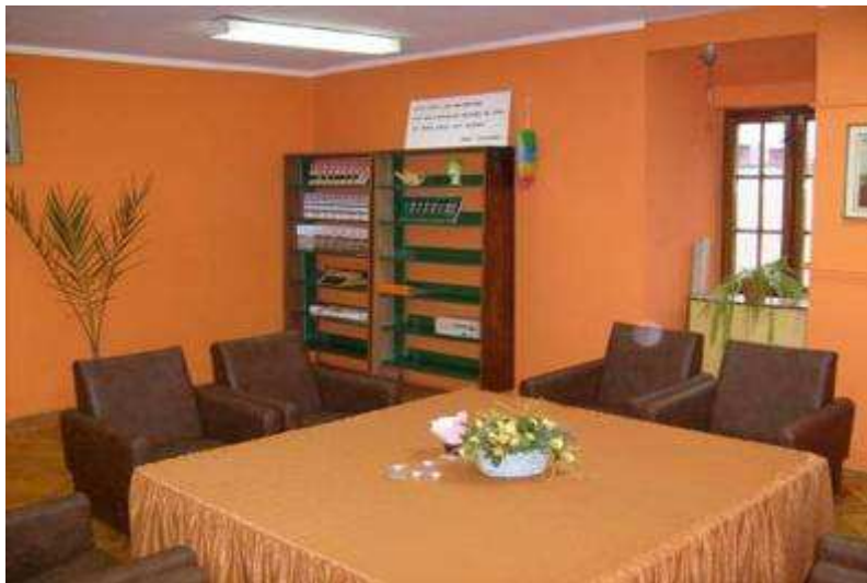
Rysunek 20. obecnie miejsce spotkań Dyskusyjnego Klubu Książki, stan z 2008 r. II piętro.