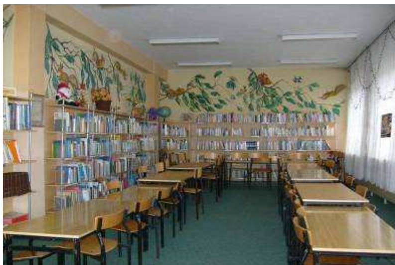
Rysunek 12. Czytelnia dla dzieci, stan z 2008 r. Parter.