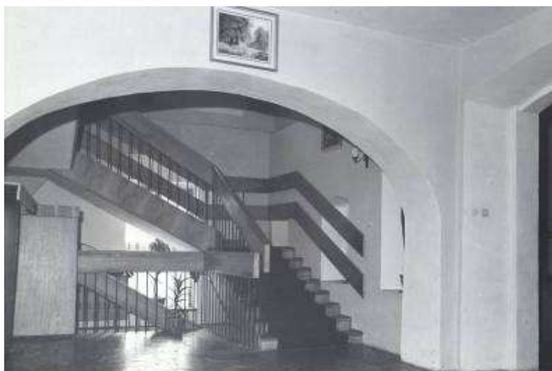
Rysunek 9. Hall wystawowy na parterze, stan z 1982 r.