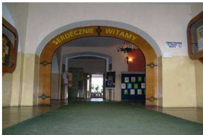
Rysunek 6. Hol na parterze, stan z 2008 r. Parter.