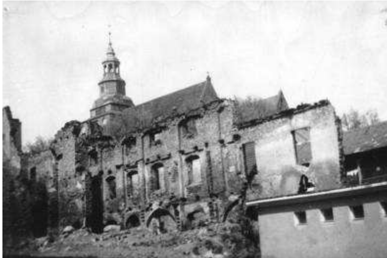
Rysunek 1. Budynek biblioteki, widok od strony południowo – zachodniej, stan z 1952 r.