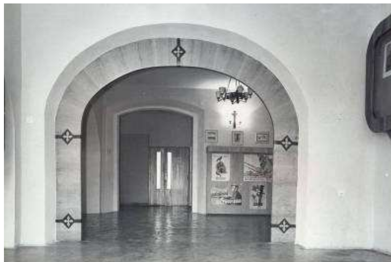
Rysunek 5. Hol na parterze, stan z 1982 r. Parter.