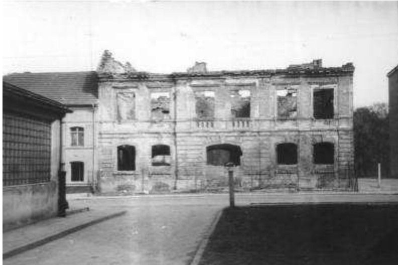
Rysunek 27. Fasada budynku, stan z 1952 r.