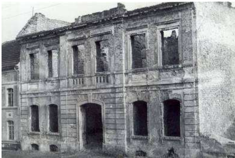
Rysunek 2. Widok w stronę fasady, stan z 1956 r.