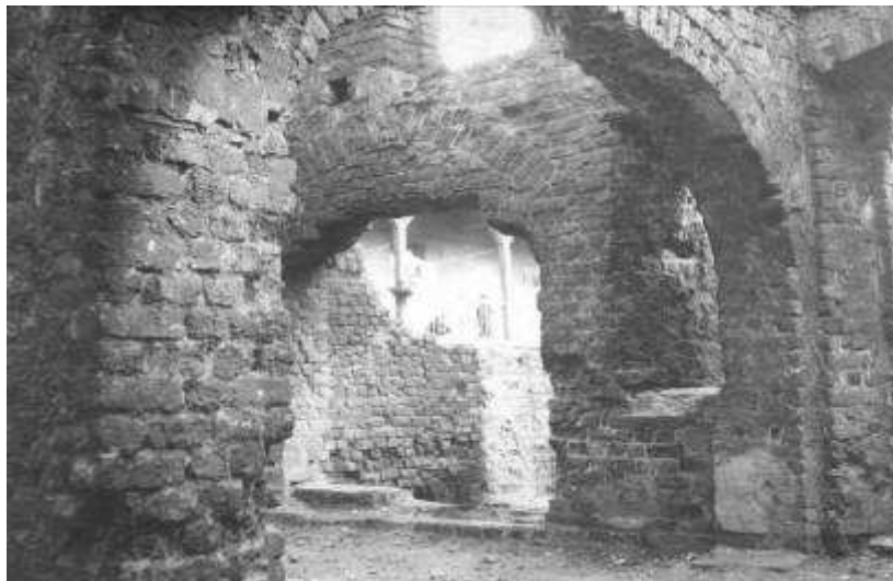
Rysunek 28. Ruiny oficyny z tyłu budynku, stan z 1952 r.