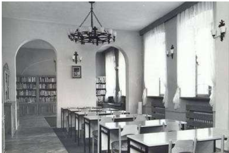
Rysunek 17. Czytelnia dla dorosłych, stan z 1982 r. I piętro.