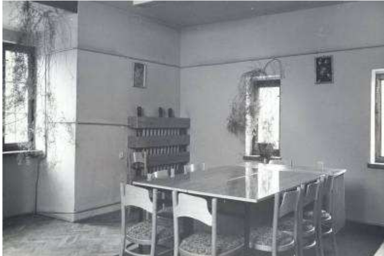
Rysunek 19. Dział ze zbiorami muzycznymi, stan z 1982 r. II piętro