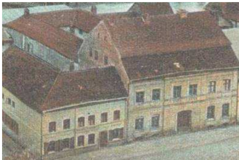
Rysunek 25. Kamienica dawnej manufaktury przy Königstraße 23, stan z 1902 r.

W dniu 3 maja 1982 roku dokonano uroczystego otwarcia obiektu pod nazwą: Wojewódzka i Miejska Biblioteka Publiczna – Oddział im. Zbigniewa Zafuskiego w Gryficach.