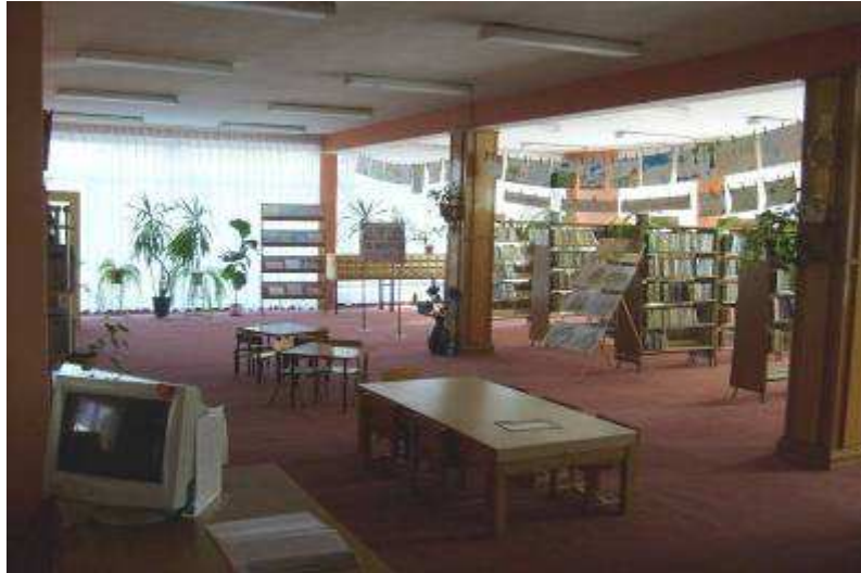
Rysunek 10. Wypożyczalnia dla dzieci, stan z 2008 r. Parter.