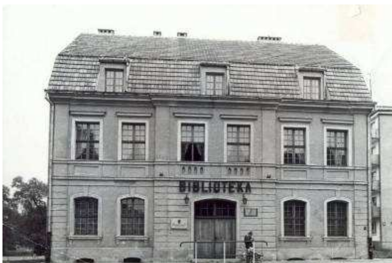
Rysunek 3. Widok w stronę fasady po ukończeniu prac budowlanych, stan z 1982 r.