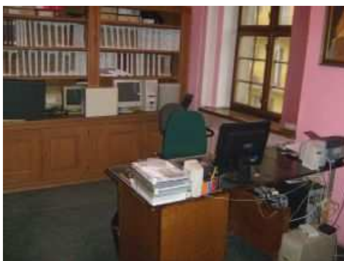
Rysunek 24. Dział Przetwarzania Danych, stan z 2008 r. I piętro.