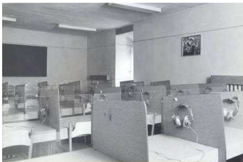
Rysunek 23. Laboratorium języków obcych, stan z 1982 r. II piętro.