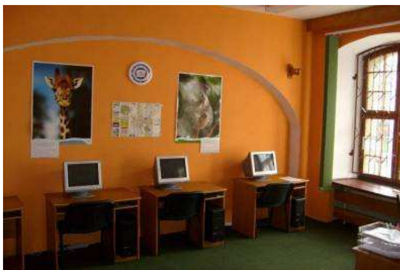
Rysunek 14. Obecnie siedziba Gminnego Centrum Informacji, stan z 2008 r. Parter.