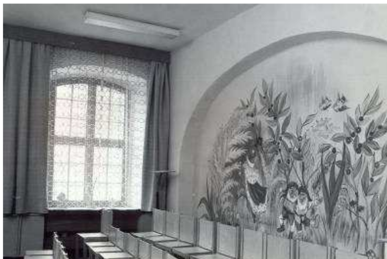
Rysunek 13. Sala bajek, stan z 1982 r. Parter