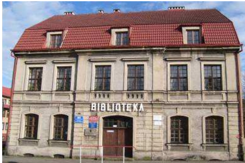
Rysunek 4. Widok w stronę fasady, stan z 2008 r.