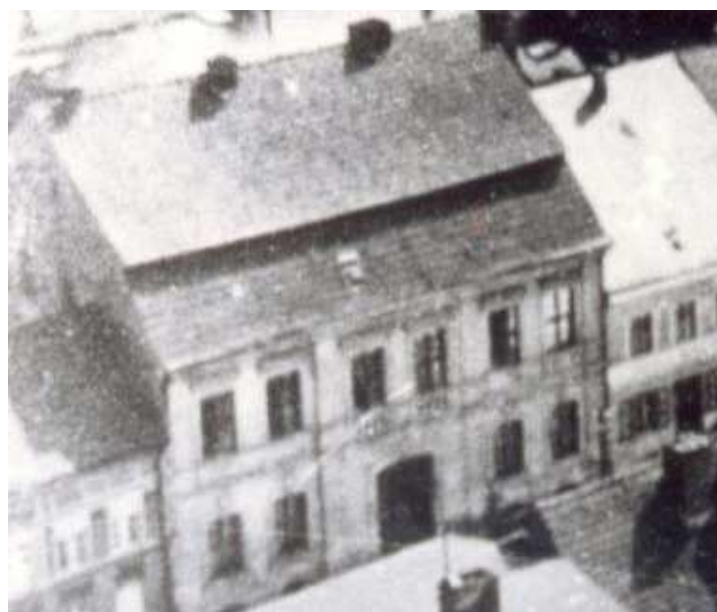
Rysunek 26. Kamienica przy Königstraße 23, stan z 1930 r.