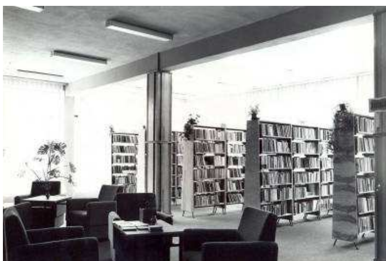
Rysunek 15. Wypożyczalnia dla dorosłych, stan z 1982 r. I piętro.