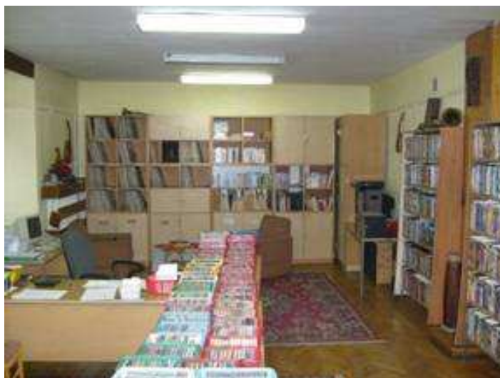
Rysunek 22. Obecnie Dział Zbiorów Specjalnych (Dział Muzyczny), stan z 2008 r. II piętro.